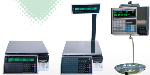
sm 100 - bench