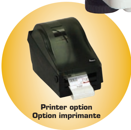
Printer option Option imprimante